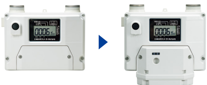
取り付け適用メーター

メーター一体型NCUをメーター端子部に設置。 既設の都市ガス用MU型保安ガスメーター に、取り付け可能。