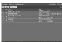
燃焼機器調査入力画面