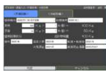
供給設備・貯蔵設備点検画面