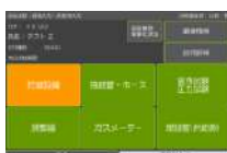
供給設備点検画面