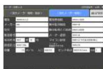
メータ交換入力画面