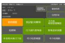
消費設備調査入力画面