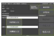
調査入力開始画面

点検調査の入力が簡単で抜けモレがないし、 14条書面交付や周知の結果も記録できるし、 お客様の確認サインはタブレット上に書けるし、 あとからPCに入力しなおす必要もないから 「字が汚くて読めない!」と怒られることも ないし、助かるなあ～